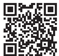
申込フォーム QR コード

先着順とさせていただきますが、お申込が多数の場合は当方にて ご参加日を調整させていただくことがございます。