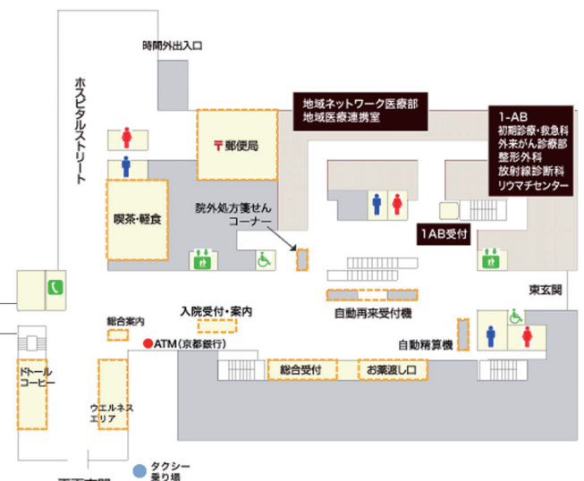
【外来棟 1 階】