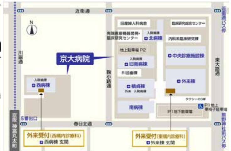
【周辺図 および 京大病院全体図】