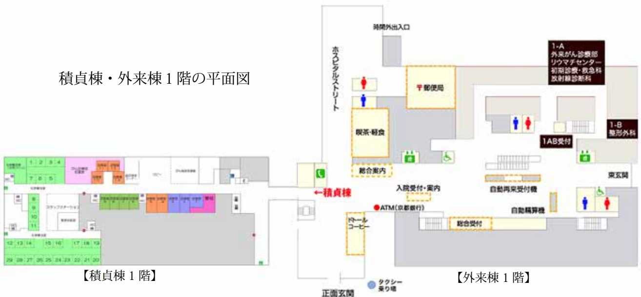
【積貞棟 1 階】