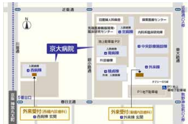
【周辺図 および 京大病院全体図】