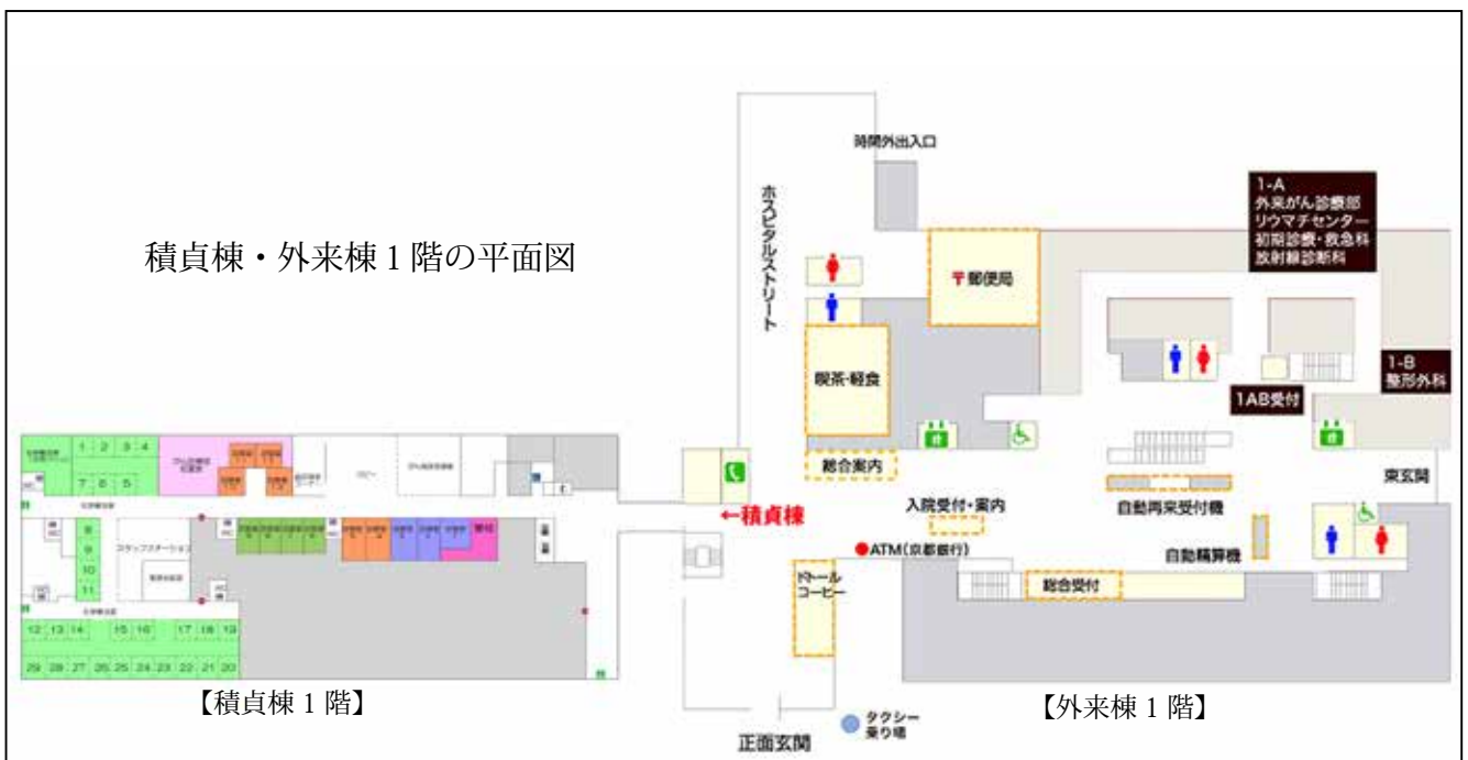
【積貞棟 1 階】